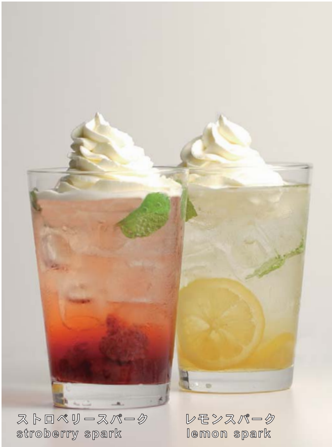
ストロベリースパーク strawberry spark