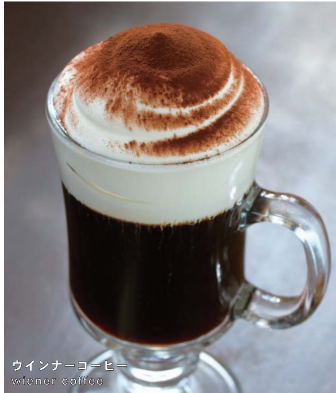
ウイナーコーヒー wiener coffee