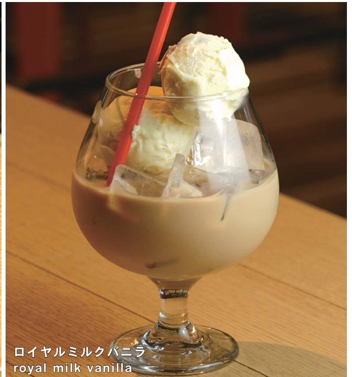
ロイヤルミルクバニラ royal milk vanilla