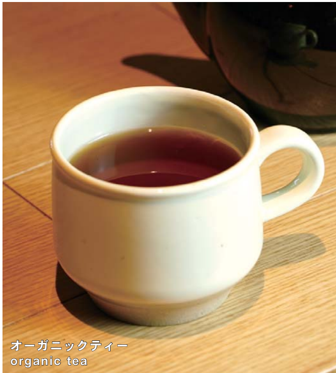
オーガニックティー organic tea