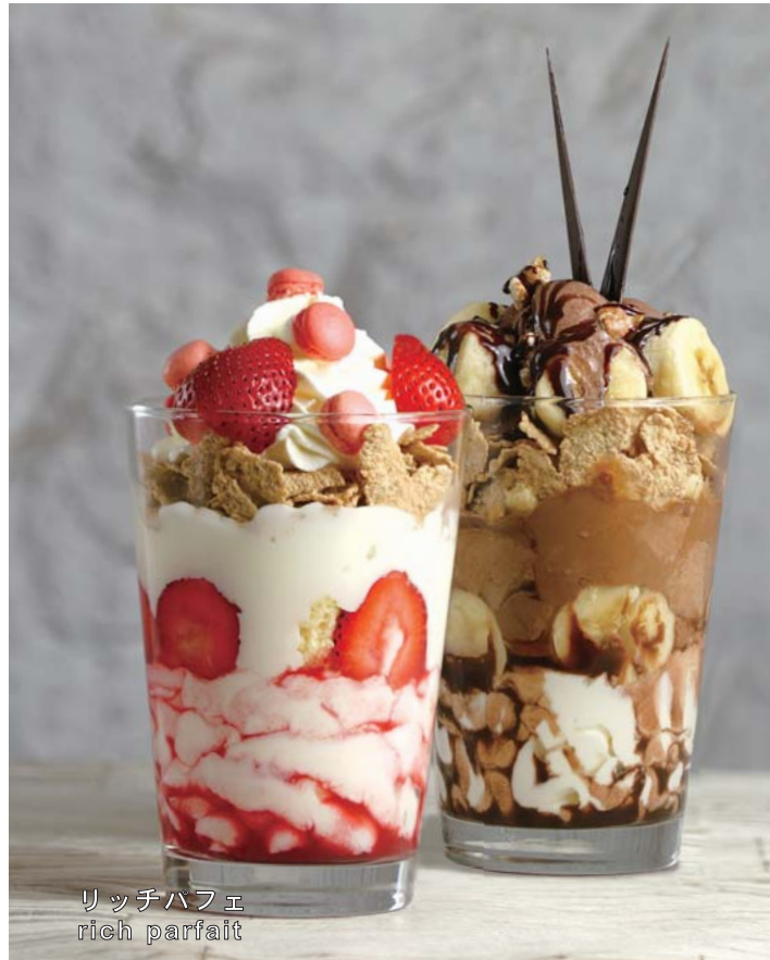
リッチパフェ rich parfait